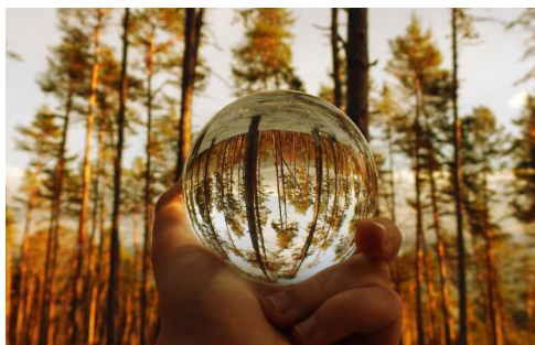
Simon Svitok - Čarovný les

ODBORNÁ POROTA: RADOVAN STOKLASA KAROL KOBELLA PAVOL REMIAŠ